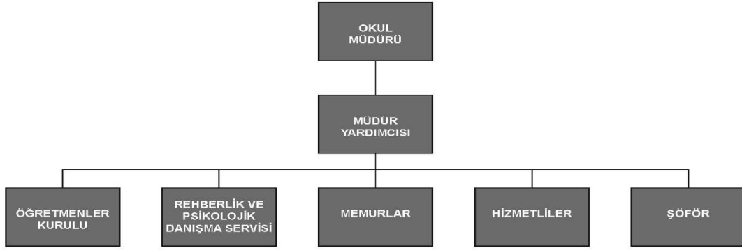
Tablo 6. Okul Teşkilat Şeması